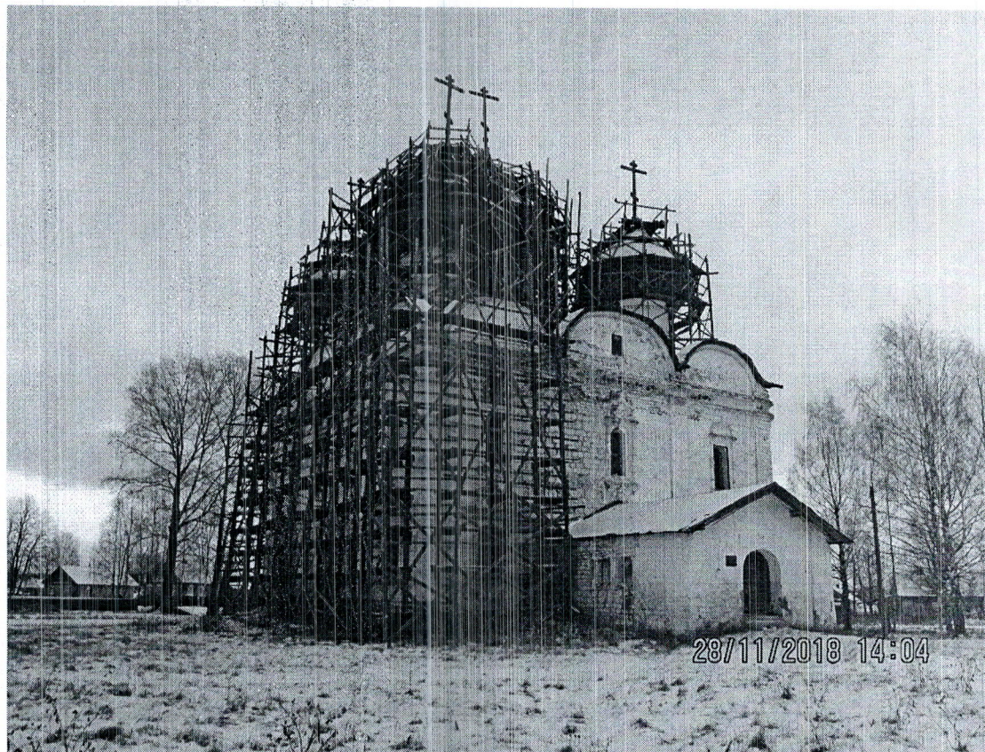
Фото здания, расположенного по адресу: ул.3-го Интернационала, д.8 в г. Каргополе