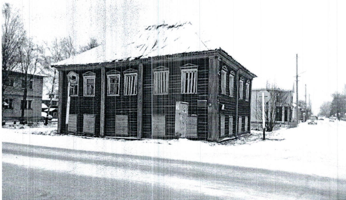
Фото здания, расположенного по адресу: ул. Ленинградская, д.20 в г. Каргополе