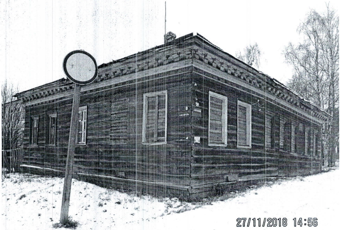
Фото здания, расположенного по адресу: пр. Октябрьский, д.39 в г. Каргополе