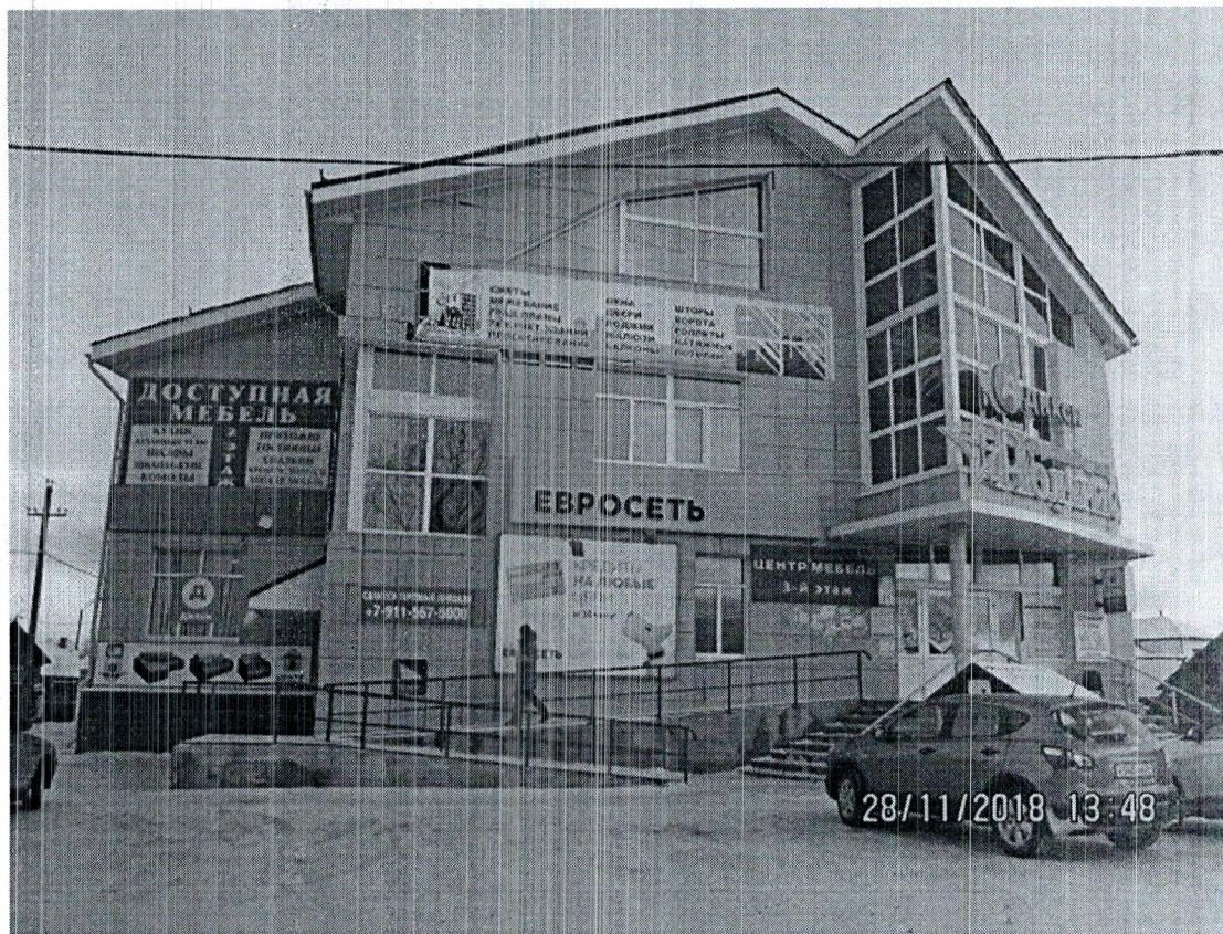
Фото здания, расположенного по адресу: ул. Архангельская, д.48 в г. Каргополе