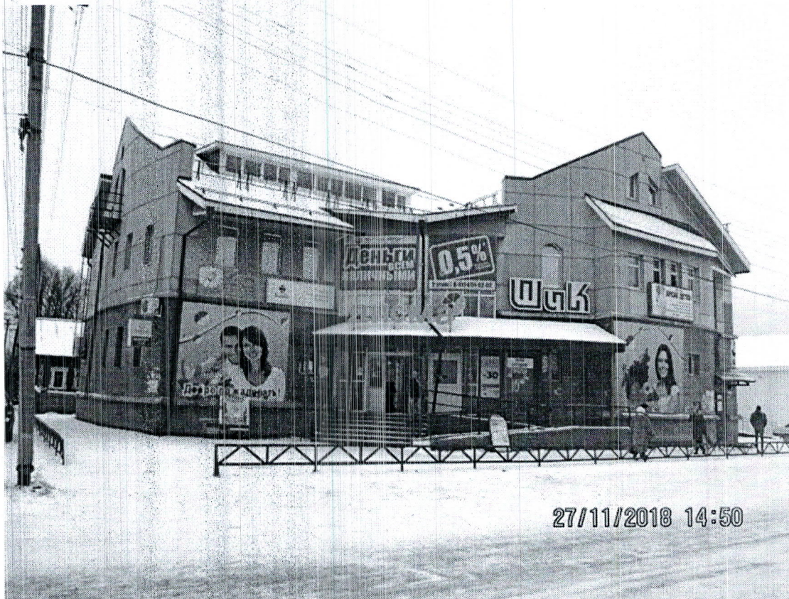
Фото здания, расположенного по адресу: ул. Ленина, д.55 в г. Каргополе