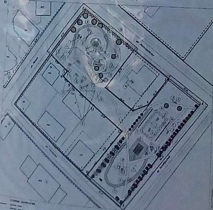
Легенда: виды архитектурных форм и материалы отделки